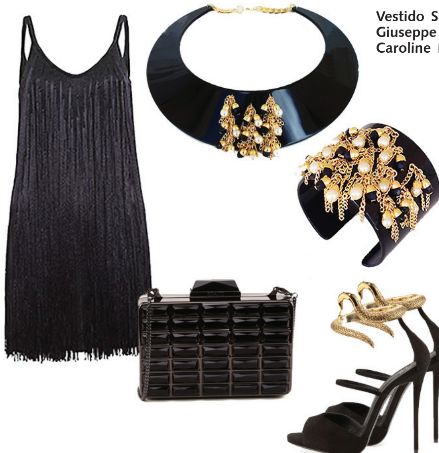
Vestido Shoulder, Clutch Schutz, Sandália Giuseppe Zanotti, Colar e Bracelete loja on line Caroline Demolin

Mais tarde, outra personalidade que influenciou gerações e ainda é inspiradora — Audrey Hepburn corroborou por tornar imortal e consagrar o vestidinho preto.