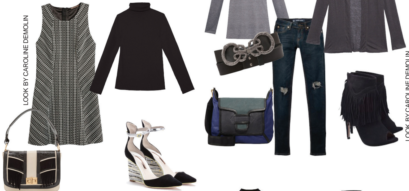
Blusa Le Lis Blanc Deux, Casaco Ateen, Calça John John, Cinto Thelure, Bolsa Pierre Hardy, Bota Luíza Barcelos