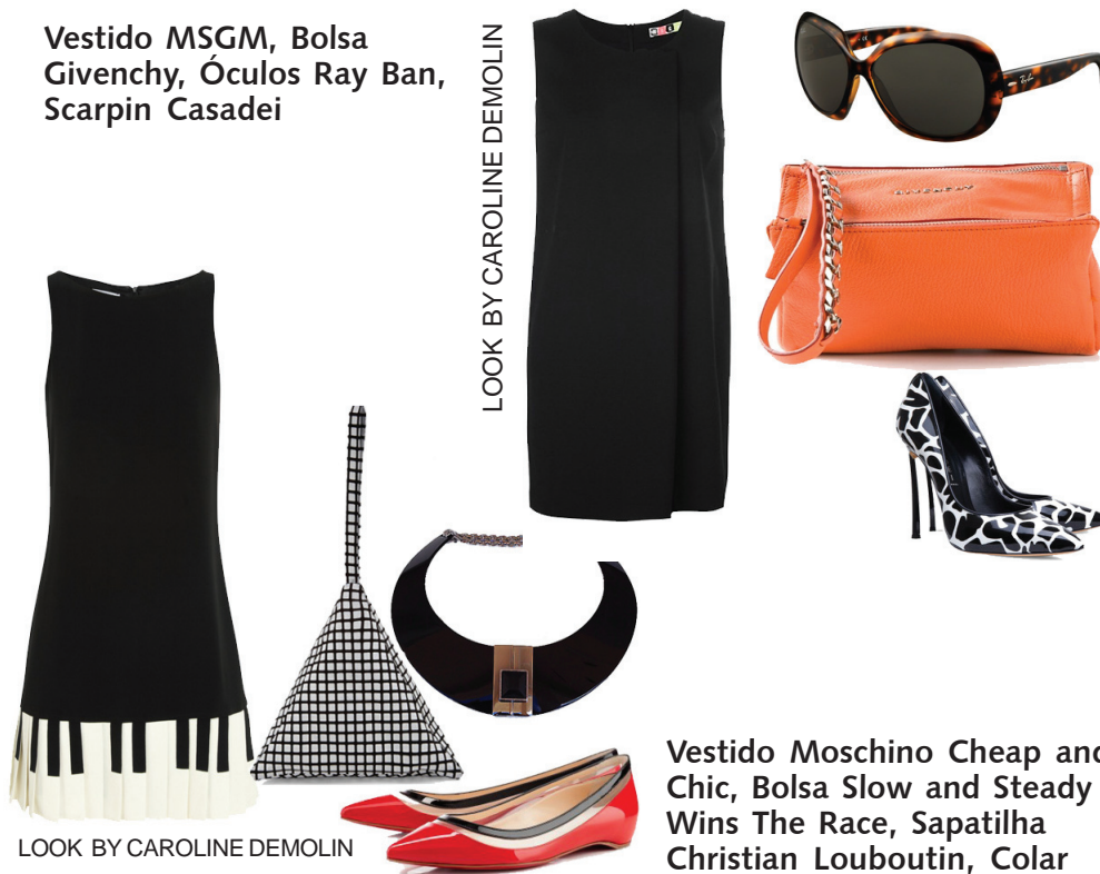
LOOK BY CAROLINE DEMOLIN