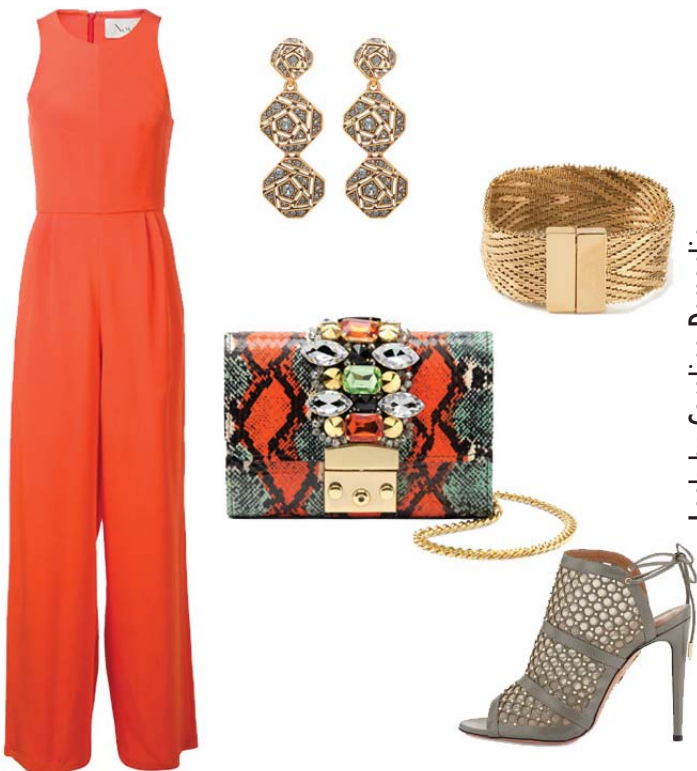
Macacão Novis, Sandália Aquazzura, Bolsa Gedebe, Brincos Oscar de La Renta, Bracelete Givenchy

Uma noite festiva, é a proposta do segundo look ! O efeito clean do macacão monocromático faz um contraponto com os acessórios elaborados e o resultado é simplesmente sofisticado!