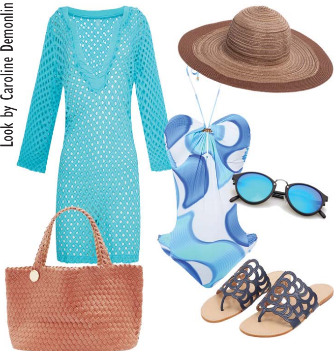
Saída Sub, Maiô Amir Slama, Bolsa Salinas, Rasteira Luiza Barcelos, Chapéu Market 33, Óculos Spektre

Para quem está começando o ano com o pé na areia e em grande estilo, aí vão algumas inspirações!