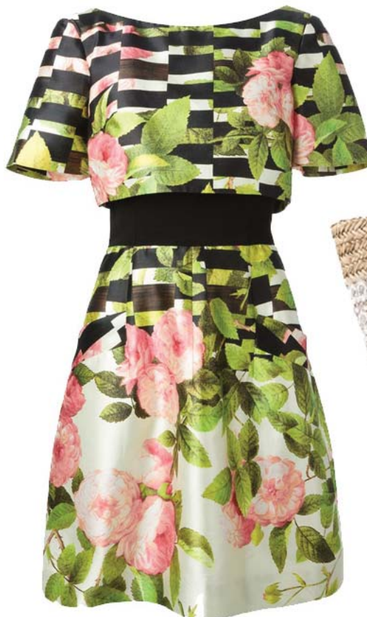
Vestido Emilio Pucci, Bolsa Armani, Sandália Le Lis Blanc, Óculos Linda Farrow, Braceletes Hervé Van Der Straten