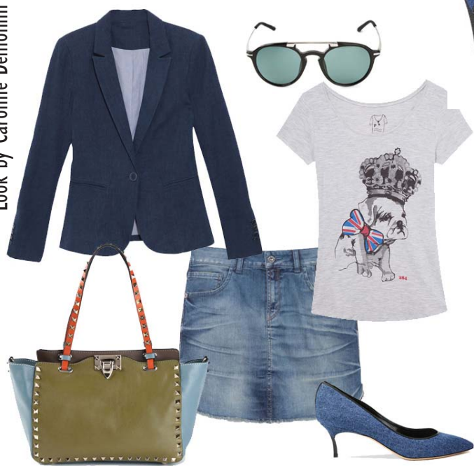
Blazer Animale, Saia 2nd Floor, T-Shirt 284, Bolsa Valentino Garavani, Óculos Dries Van Noten, Scarpin Casadei

formais como as compras, cinema, lanche com as amigas e quem sabe uma pizza no final do dia.