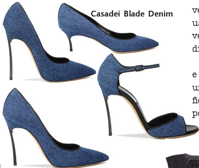
Casadei Blade Denim

Os modelos são extremamente clean e sofisticados, provando mais uma