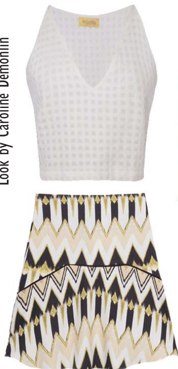
Top Isabella Giobbi, Saia Spezzato, Bolsa Schutz, Rasteira Animale, Brincos Cláudia Arbex