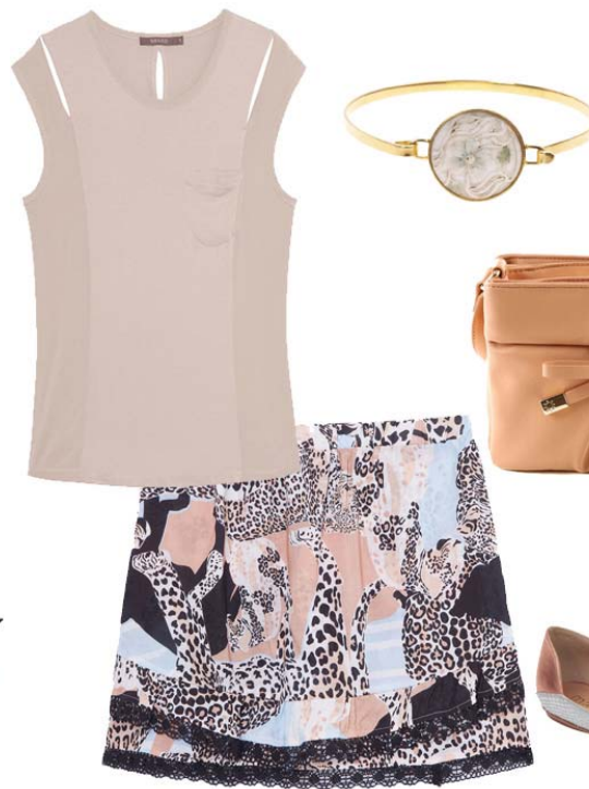
Blusa Mixed, Saia Mumi, Sapatilha Manolita, Bolsa Schutz, Pulseira Isabella Blanco