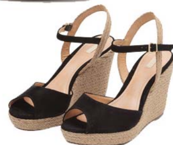
Look by Caroline Demonlin