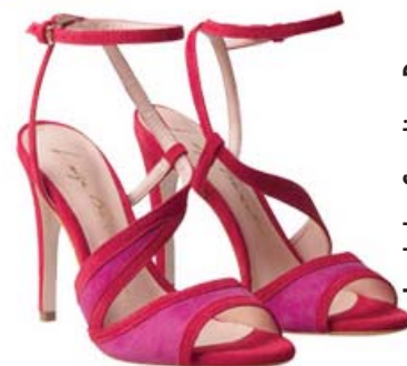
Look by Caroline Demonlin