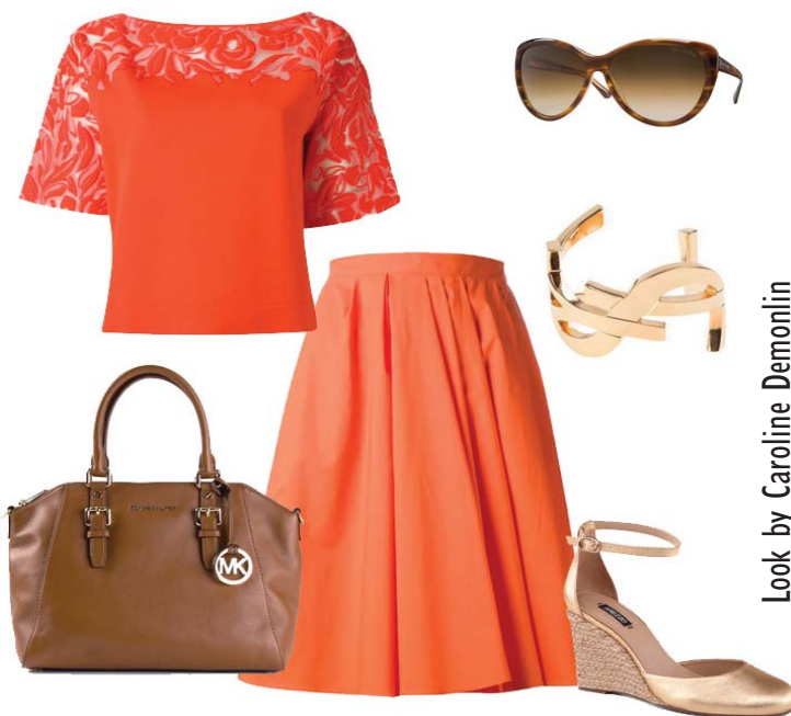
Top Blumarine, Saia Carven, Bolsa Michael Kors, Espadrille Arezzo, Óculos Tom Ford, Bracelete Saint Laurent