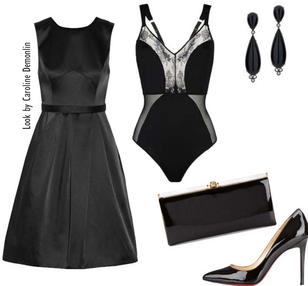
Look by Caroline Demonlin

lar por nós mesmas e deixar o stress de lado.