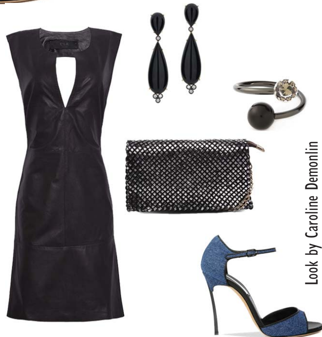
Vestido Clé, Clutch Arezzo, Brincos Ana Tinelli, Pulseira Armani, Sandália Casadei

Mas as opções não param por aqui. Dentro do seu estilo, com certeza, existe uma ótima maneira de incorporar o denim.