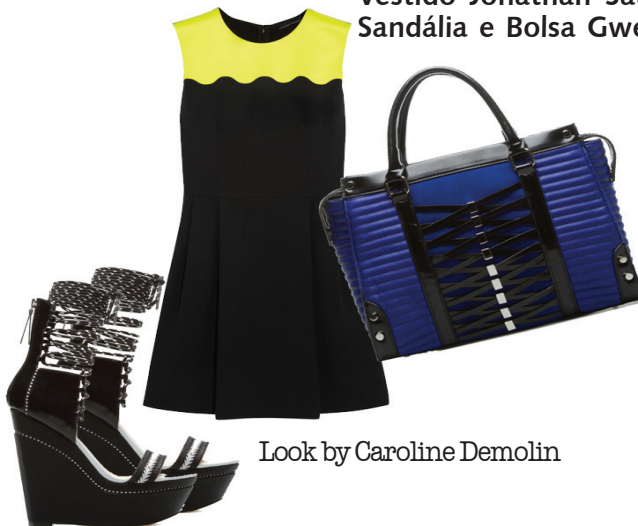
Vestido Jonathan Saunders, Sandália e Bolsa Gwen Stefani

Os shapes são arrojados como a cantora. Bolsas de grandes dimensões, plataformas e saltos altos, tudo bem Gwen Stefani!