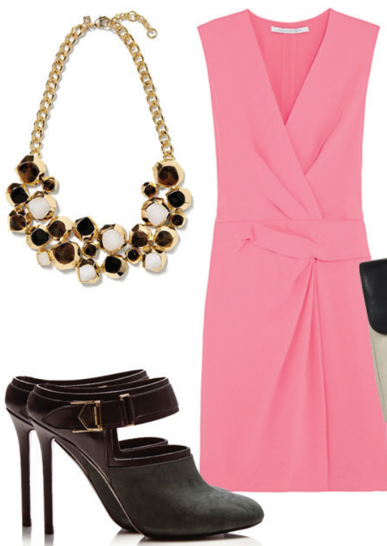
Wrap Dress e Clutch Diane Von Furstenberg, Sapato Nicholas Kirkwood, Colar Banana Republic

Interagindo com o público, existe no site da marca um espaço denominado “Tell us your Wrap Story” destinado às clientes, para que elas enviem fotos ou vídeos vestindo seu Wrap Dress e contem a história deste momento especial.