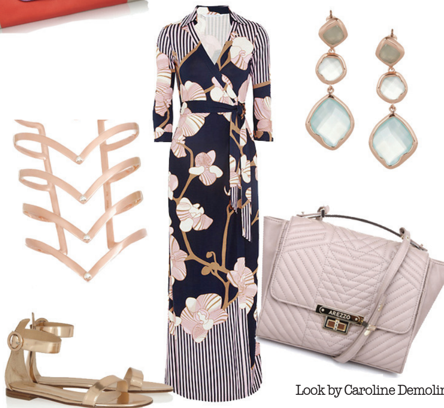
Wrap Dress Diane Von Furstenberg, Sandália Gianvito Rossi, Bracelete Ana Khouri, Brincos Monica Vinader, Bolsa Arezzo

O Council of Fashion Designers of America (CFDA) concedeu o Lifetime Achieve-