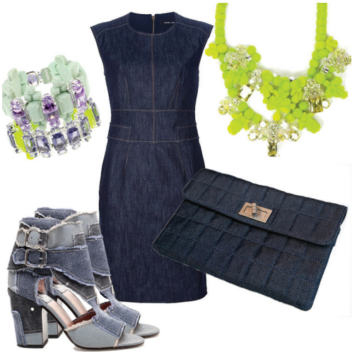
Vestido Derek Lam, Sandália Laurence Dacade, Clutch Chanel, Braceletes e Colar Ek Thongprasert

Nenhuma outra peça de roupa, na história da moda, conseguiu agrupar tantas conotações e tão diversificadas, algumas vezes até mesmo antagônicas. Este é o jeans!