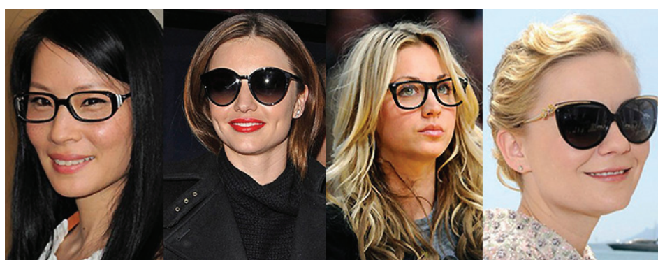
Lucy Liu, Miranda Kerr, Kaley Cuoco e Kirsten Dunst