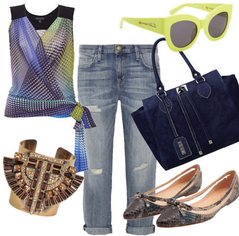
Calça Current Elliott, Blusa Alcaçuz, Óculos Karen Walker, Bolsa Santa Lolla, Bracelete Talie NK