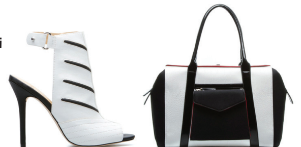
Sapato e Bolsa Gwen Stefani