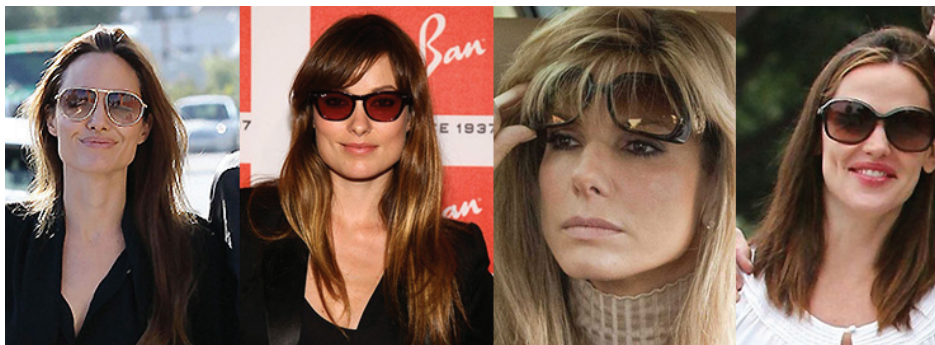
Angelina Jolie, Olívia Wilde, Sandra Bullock e Jennifer Garner

O rosto quadrado é aquele que possui maxilares bem definidos salientando o ângulo reto que se forma nas laterais do rosto. Armações com bordas quadradas irão salientar ainda mais a forma quadrada do rosto. Para que o visual fique mais suave, os formatos mais indicados são os redondos, os