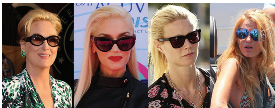
Meryl Streep, Gwen Stefani, Gwyneth Paltrow e Blake Lively