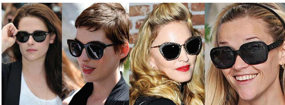
Kristen Stewart, Anne Hathaway, Madonna e Reese Witherspoon

tremos do rosto – queixo e testa. Óculos sem armação, ou com efeito degradê são ótimos para criar essa sensação de