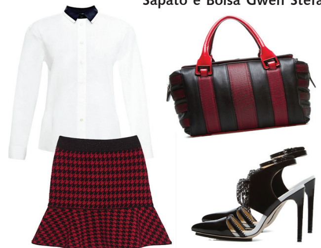
Camisa Marni, Saia Le Lis Blanc, Bolsa e Sapato Gwen Stefani