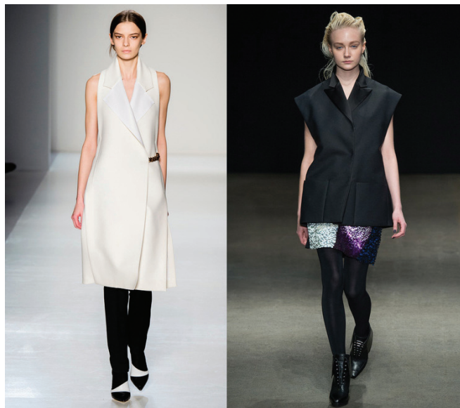
Desfiles FW 2014 Victória Beckham e Phillip Lim