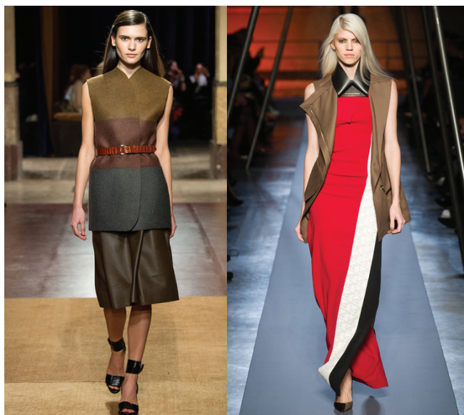
Desfiles FW 2014 Hermés e Roland Mouret