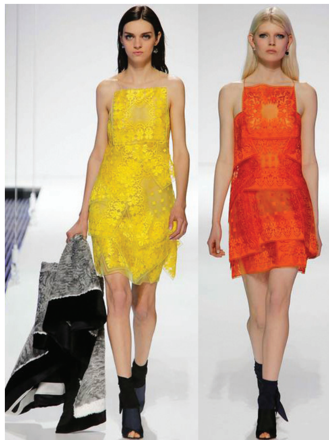
Desfile Resort 2015 Christian Dior

Um pouco de frio na barriga é bom para quebrar a monotonia!