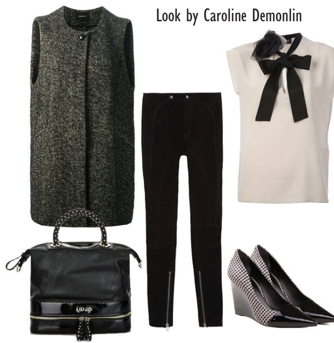
Look by Caroline Demonlin