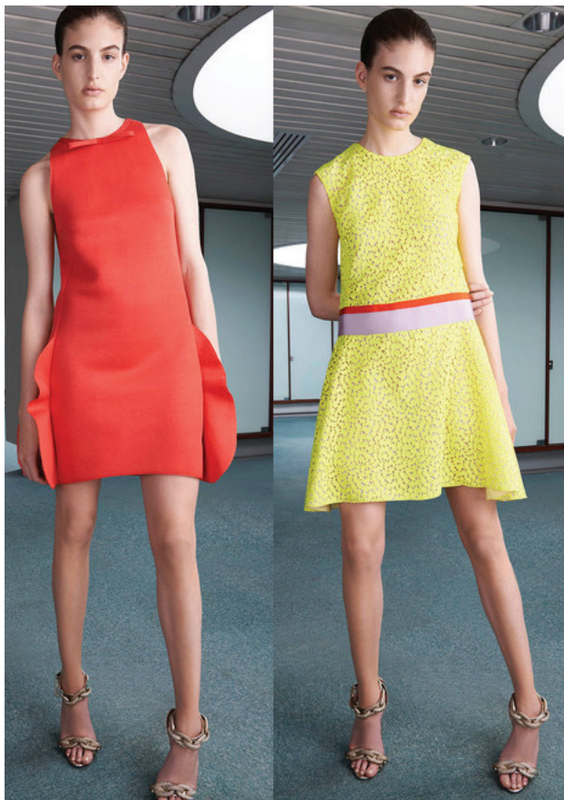
Desfile Resort 2015 Giambattista Valli

É necessário muito estilo para conduzir estes looks com tons intensos como o amarelo, o laranja e o vermelho. Eles são ousados e precisam estar totalmente alinhados ao perfil de quem usa e adequados à ocasião para ficarem arrojados e elegantes ao mesmo tempo. Caso contrário, tenha muito cuidado porque a linha que separa o chique do cafona é tênue!