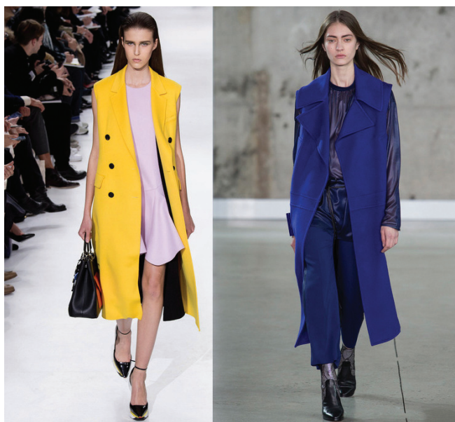
Desfiles FW 2014 Christian Dior e Reed Krakoff

As mulheres vêm se apropriando de referências do vestuário masculino e incorporando com muito charme e estilo em seu guarda-roupa. Não encaro isto como uma inversão de papéis, como muitos sugerem, mas sim uma troca saudável, um compartilhamento que propõe relacionamentos mais democráticos.