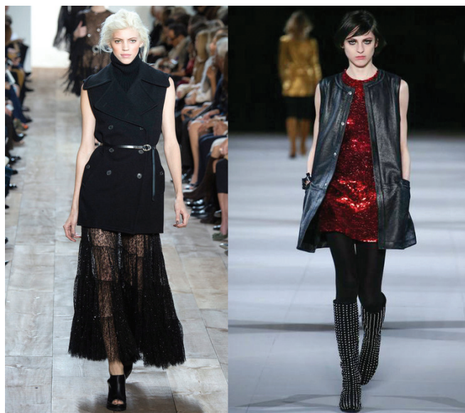
Desfiles FW 2014 Michael Kors e Saint Laurent