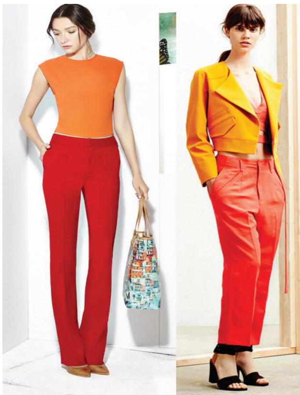
Desfiles- Resort 2015 Alicia + Olivia e Derek Lam 10 Crosby

LOOKS COM TONS SOLARES PARA ENTRAR NO CLIMA DO VERÃO!