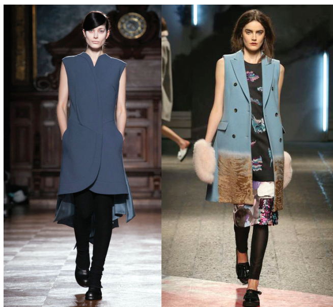
Desfiles FW 2014 Aganovich e MSGM