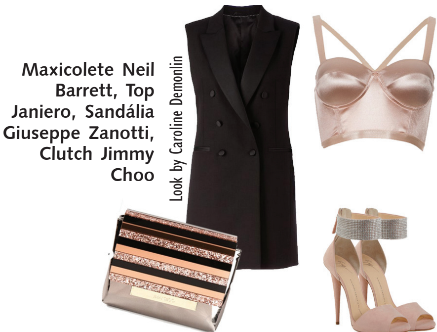
Maxicolete Neil Barrett, Top Janiero, Sandália Giuseppe Zanotti, Clutch Jimmy Choo