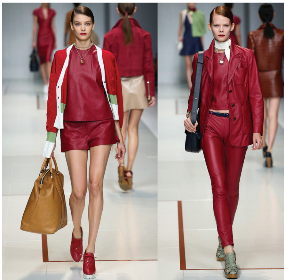
Desfile Trussardi SS 2015

E provando o que eu disse a respeito do cereja ser uma ótima opção para vários momentos, aí vai um look praia. Todos os acessórios são em tons neutros e até mesmo a estampa da saída é suave para deixar o destaque para o cereja do look!