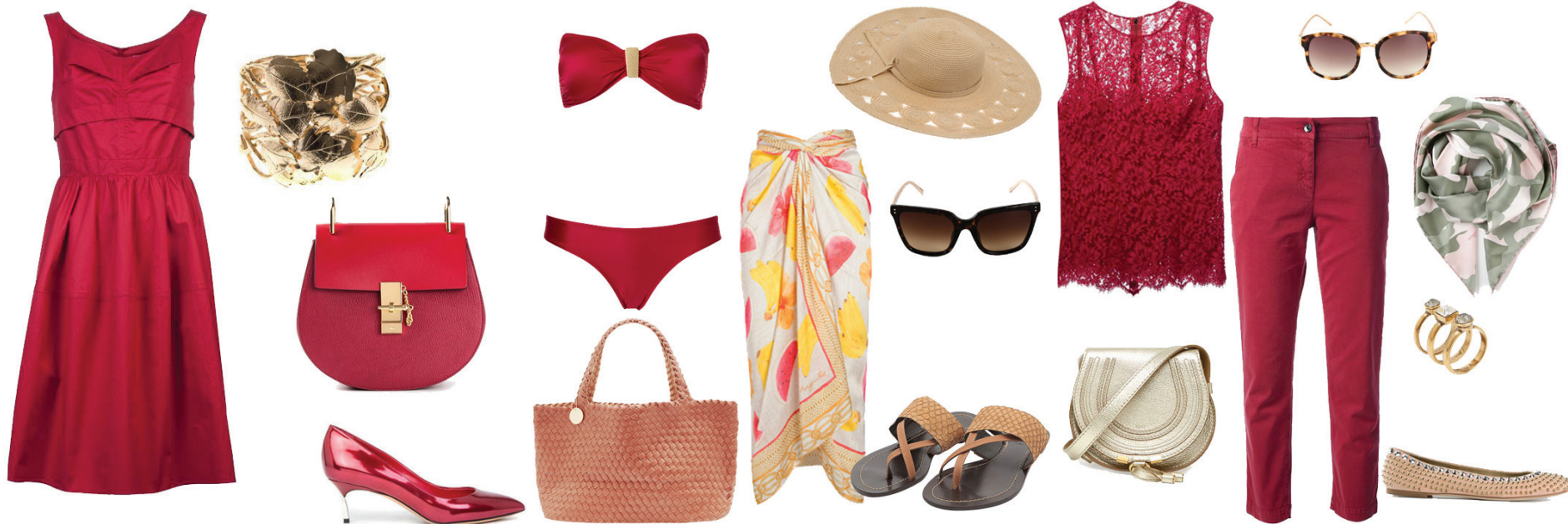
Vestido Carven, Scarpin Casadei, Bolsa Chloé, Bracelete Aurelie Bidermann