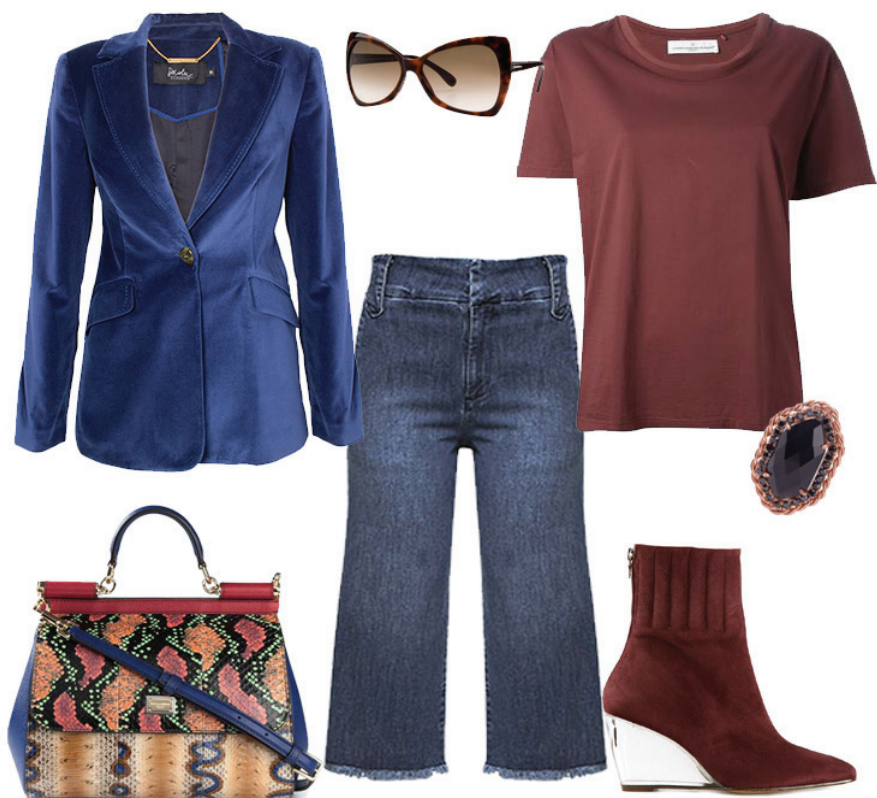
Blazer Daslu, T-Shirt Golden Goose Deluxe Brand, Calça Culotte Mixed, Bota Courrèges, Bolsa Dolce & Gabbana, Anel Bianca Bertoni, Óculos Tom Ford

Ainda não tem a sua? Então coloca no topo da sua lista de aquisições para a temporada!