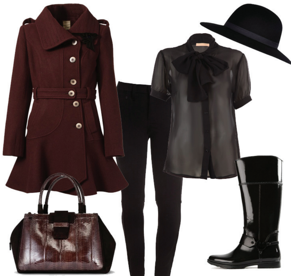
Casaco Saad, Blusa Carol Bassi, Calça Coven, Bolsa Aquatalia, Chapéu River Island, Galocha Michael Kors

Na bela e encantadora Veneza, é usual homens e mulheres colocarem suas galochas para transitar pe-