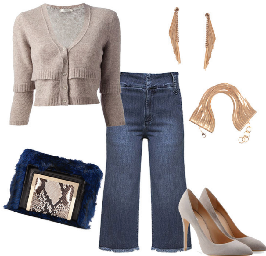
Tricô Nina Ricci, Calça Culotte Mixed, Scarpin Armani, Clutch Jimmy Choo, Brincos Animale, Pulseira Bee Vee