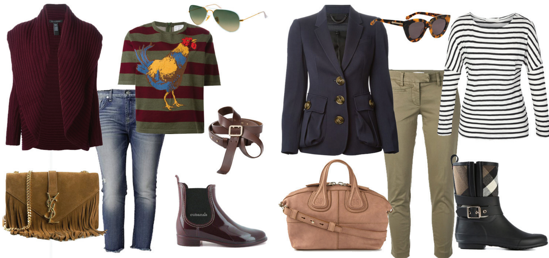
Tricô Ralph Lauren, Calça 7 for All Mankind, Blusa Stella Jean, Bolsa Saint Laurent, Óculos Ray Ban, Cinto Dsquared2, Galocha Cubana