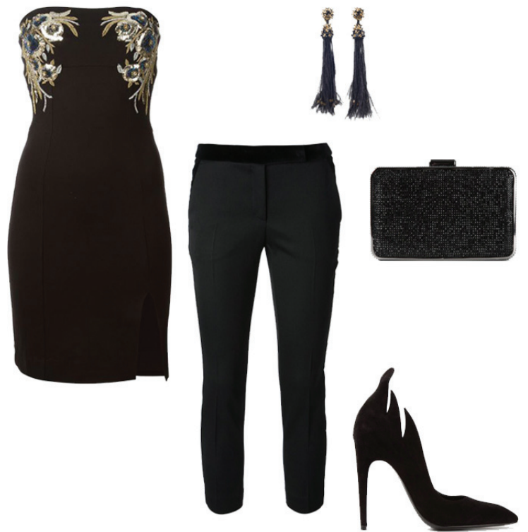
Vestido Dsquared2, Cigarete Alexander McQueen, Scarpin Bottega Veneta, Clutch Michael Kors, Brincos Oscar de La Renta