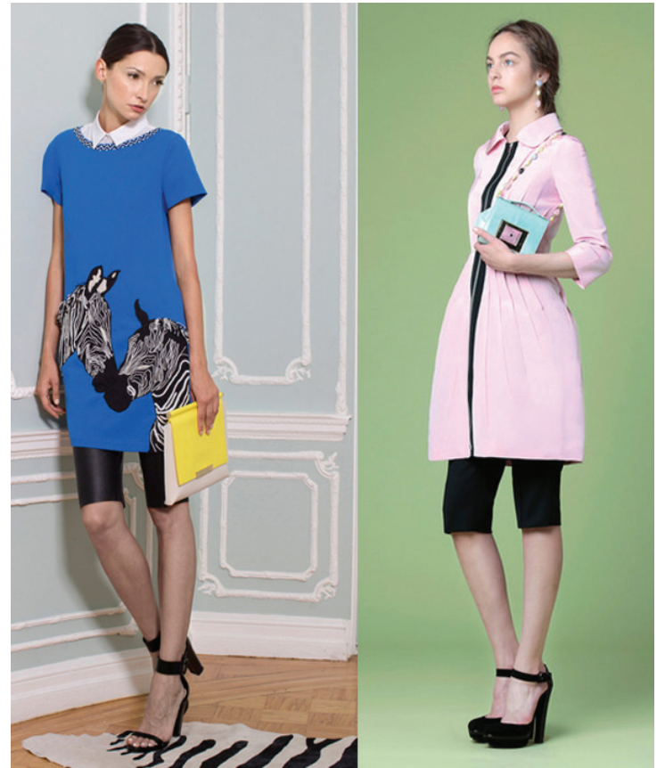
Alicia + Olívia SS 2015 Andrew Gn Resort 2015