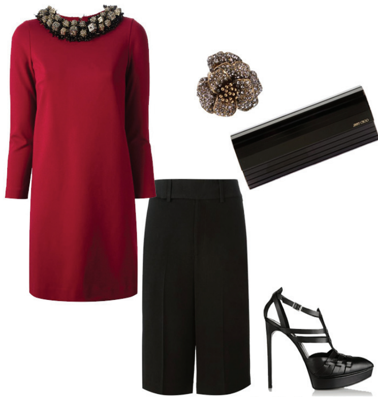
Vestido Dsquared2, Bermuda Helmut Lang, Sandália Saint Laurent, Clutch Jimmy Choo, Anel Hector Albertazzi