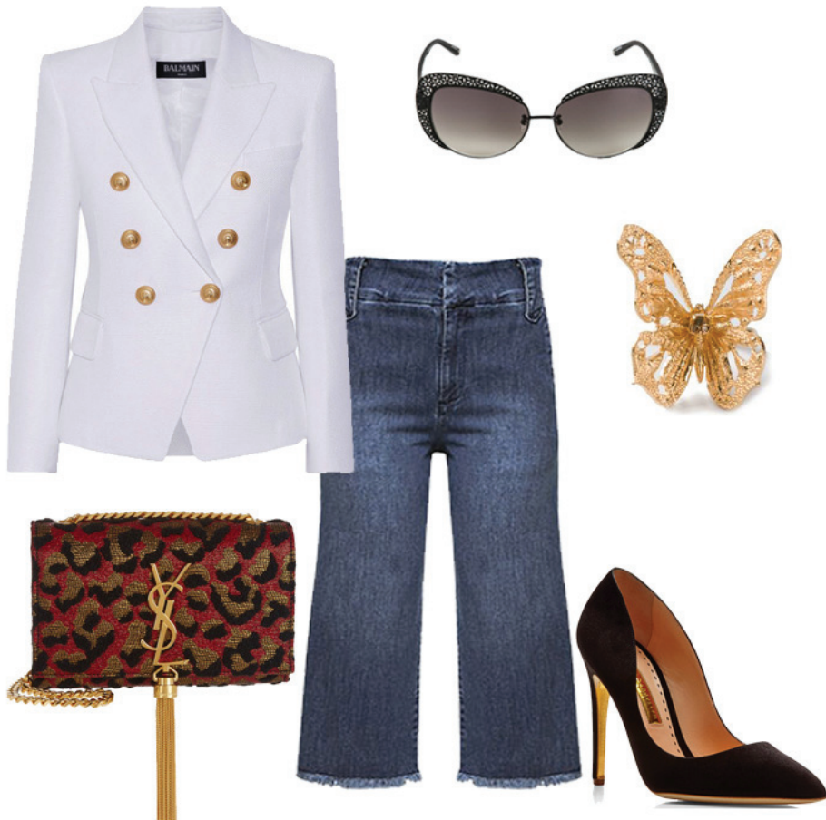
Blazer Balmain, Calça Culotte Mixed, Scarpin Rupert Sanderson, Bolsa Saint Laurent, Anel Alexander McQueen, Óculos Oscar de La Renta

Este shape ultra charmoso me conquistou de vez! As calças culotte são simplesmente super confortáveis e estilosas. Aquele tipo de peça que faz uma diferença significativa nos looks, tirando a produção mais basic do lugar comum e elevando seu status. A intenção é ficar chique!