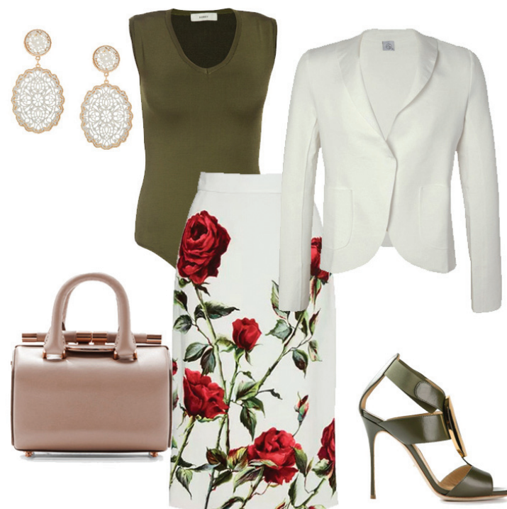
Saia Dolce & Gabbana, Body Egrey, Blazer Fit, Sandália Sérgio Rossi, Bolsa Tyler Alexandra, Brincos Duza