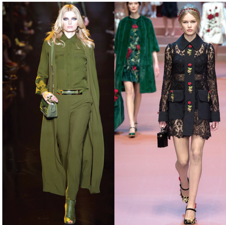
Desfiles Elie Saab e Dolce & Gabbana Fall 2015

Atenção especial para os bolsos cargo que estão super em alta! Mas nada exagerado, olhando por um prisma macro eles estão mais minimalistas!