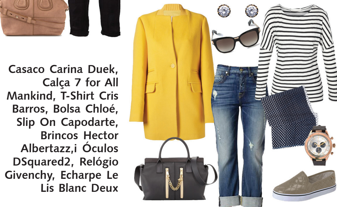
Casaco Carina Duek, Calça 7 for All Mankind, T-Shirt Cris Barros, Bolsa Chloé, Slip On Capodarte, Brincos Hector Albertazzi, Óculos DSquared2, Relógio Givenchy, Echarpe Le Lis Blanc Deux

cômoda a viagem com aqueles mil acessórios, ainda dá trabalho na hora de passar pelo raio X. Um relógio bacana é uma peça necessária que além de ter atitude ainda ajuda a não perder a hora! Brincos, anel e pulseira, se for o caso, pequenos que não agarrem nas roupas e você possa passar um bom tempo com eles sem sentir incômodo. Lembre-se que numa viagem longa as extremidades podem inchar um pouco, assim como os pés as mãos também.