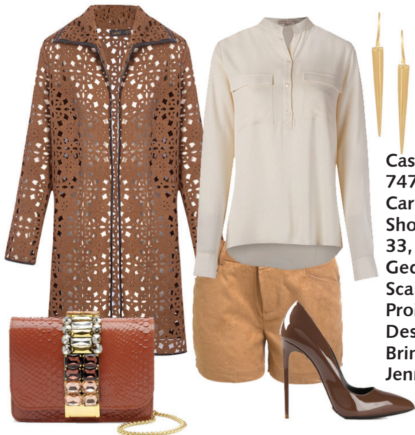
Casaco Loft 747, Camisa Carina Duek, Short Market 33, Bolsa Gedebe, Scarpin Marco Proietti Design, Brincos Jennifer Fisher

Short + trench + uma maneira charmosa de enfrentar o frio e ficar bem na fita!