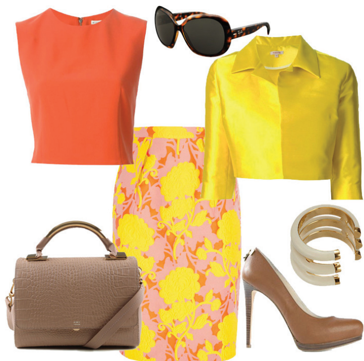
Saia Miu Miu, Top Alícia + Olívia, Casaqueto Parosh, Scarpin Michael Kors, Bolsa Schutz, Óculos Ray Ban, Bracelete Aurelie Bidermann

tero conjugado com as rosas vermelhas. Somados ao blazer branco o resultado é ultra chique.