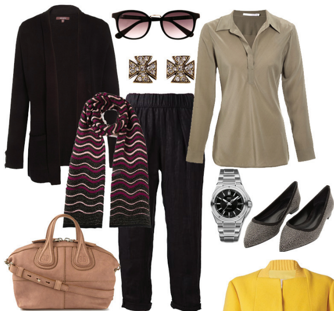
Cardigan Mixed, Camisa Animale, Calça Raquel Allegra, Sapatilha Schutz, Bolsa Givenchy, Óculos Taylor Morris, Brincos Hector Albertazzi, Cachecol Missoni, Relógio IWC