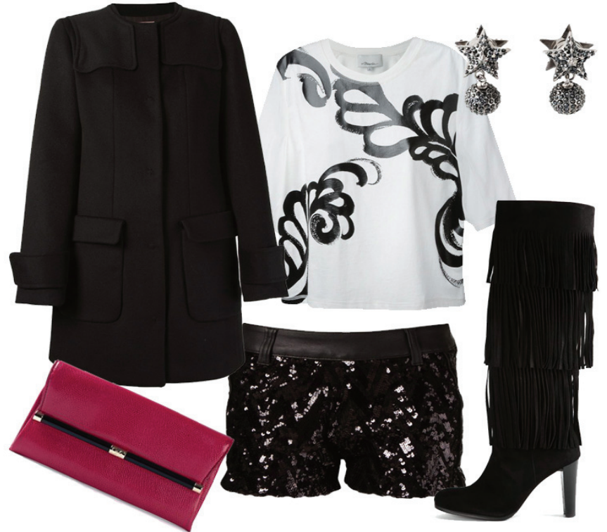
Casaco Carina Duek, Short Bobstore, Blusa Phillip Lim, Bota Stuart Weitzman, Clutch Diane Von Furstenberg, Brincos Givenchy