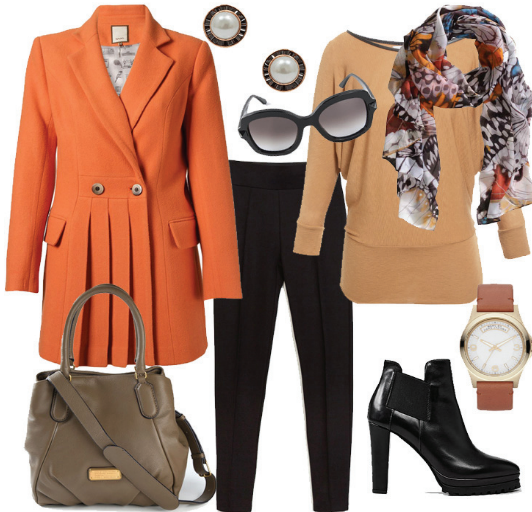
Casaco Saad, Legging Zara, Blusa Market 33, Bolsa e Relógio Marc Jacobs, Brincos Bijouxnet, Bota All Saints, Echarpe H&M, Óculos Valentino

Complementos poucos e bons! Além de ficar in-