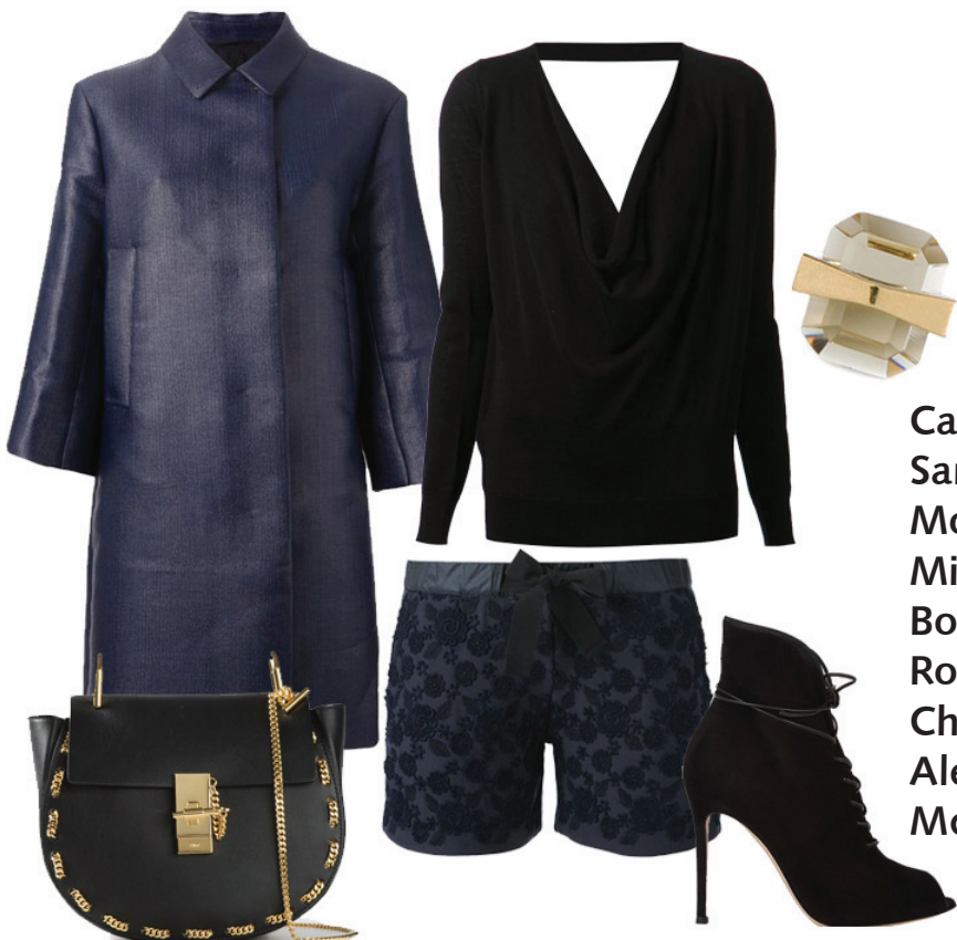
Casaco Jil Sander, Short Moncler, Blusa Michael Kors, Bota Gianvito Rossi, Bolsa Chloé, Anel Alexander McQueen