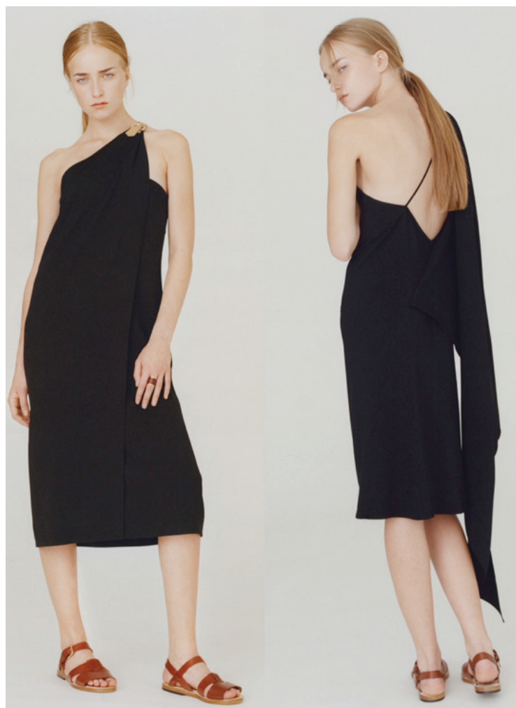
APC Spring Summer 2016

Vale lembrar! Para sustentar um look super clean precisa ter muito estilo!