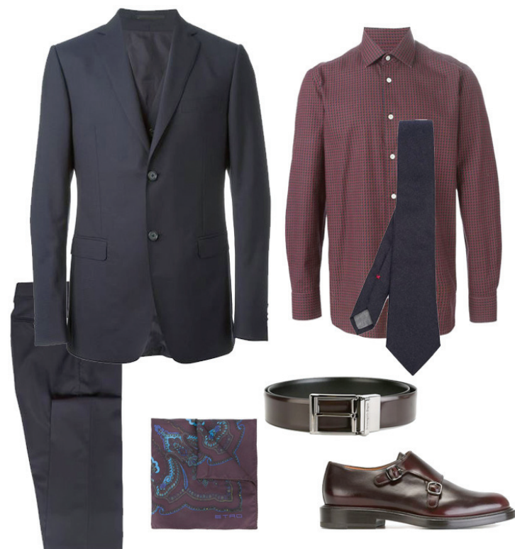
Terno Z Zegna, Camisa Massimo Piombo, Sapato Santoni, Cinto Ermenegildo Zegna, Gravata Brunello Cucinelli, Lenço Etro