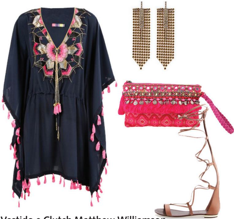
Vestido e Clutch Matthew Williamson para C&A, Sandália Schutz, Brincos Hector Albertazzi