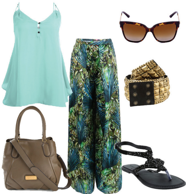
Regata, Pantalona, Rasteira e Cinto Matthew Williamson para C&A, Óculos Dolce & Gabbana, Bolsa Marc Jacobs