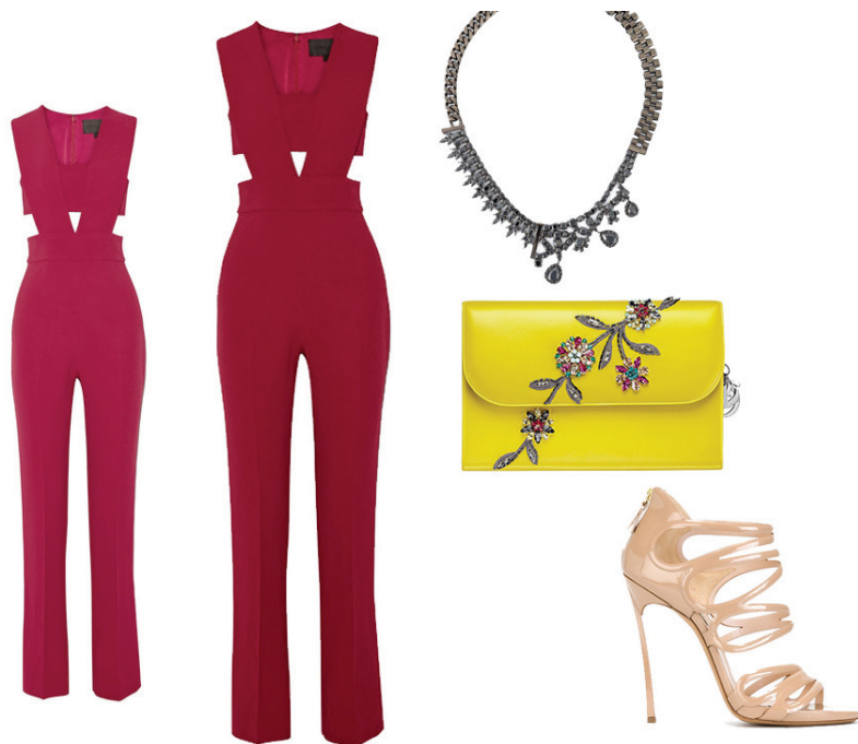
Macacão Cushnie Et Ochs, Sandália Casadei, Clutch Dior, Colar Iosselliani