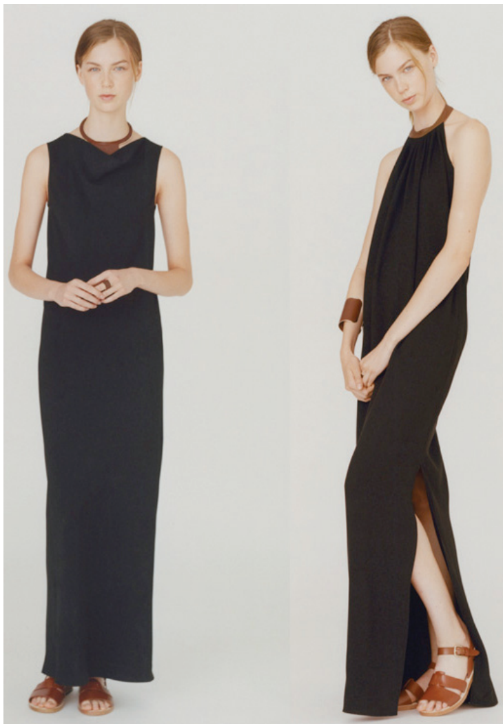
APC Spring Summer 2016

A coleção recém lançada da APC foi um exemplo