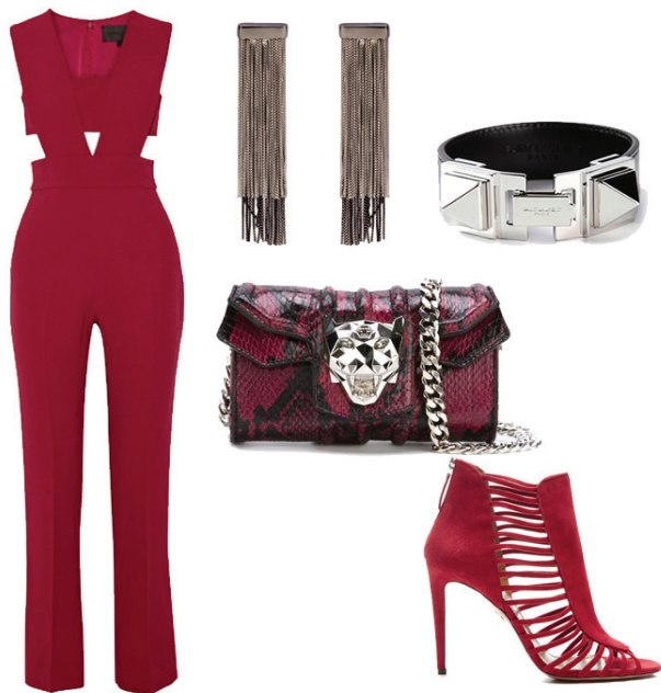
Macacão Cushnie Et Ochs, Sandália Aquazurra, Bolsa Phlipp Plein, Brincos Bianca Bertoni, Bracetele Saint Laurent

Cereja e nude é uma composição perfeita e que ainda deixa espaço para inserir um pouco mais de cor. Uma clutch é o ponto perfeito para dar este toque vibrante ao look!