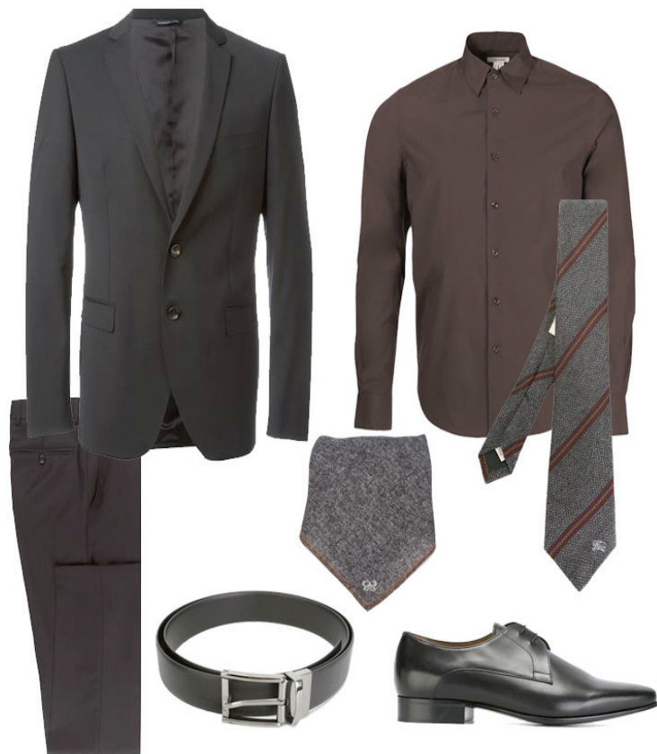
Terno Tonello, Camisa Etiqueta Negra, Sapato Givenchy, Cinto Empório Armani, Gravata Burberry, Lenço Eleventy