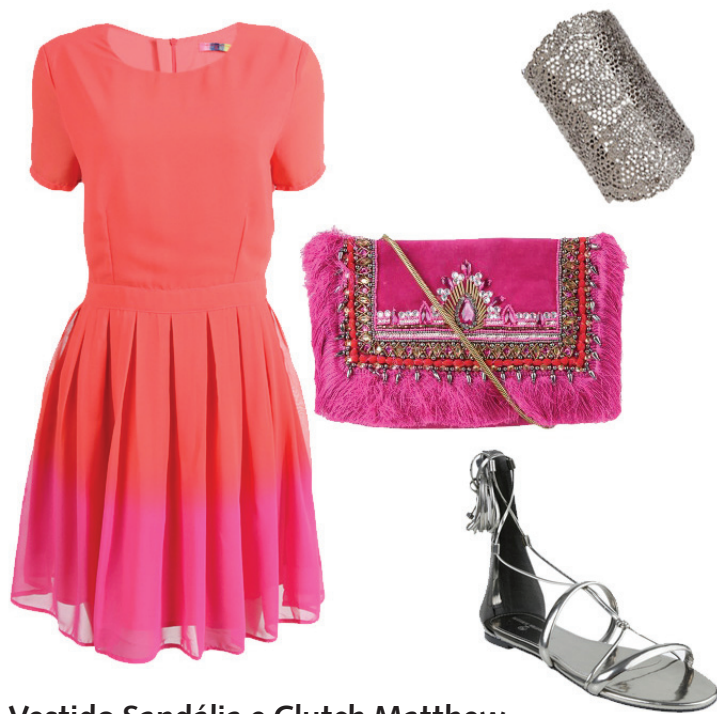
Vestido Sandália e Clutch Matthew Williamson para C&A, Bracelete Aurelie Bidermann