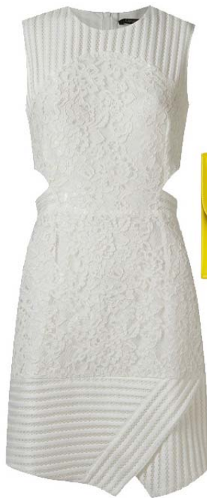
Top Derek Lam 10 Crosby, Pantacourt Joseph, Sandália Giuseppe Zanotti, Brincos Hector Albertazzi, Anéis Leticia Peranovich

E para quem quer mais que amor, quer também prosperidade, a clutch amarela arremata o look com muito glamour!