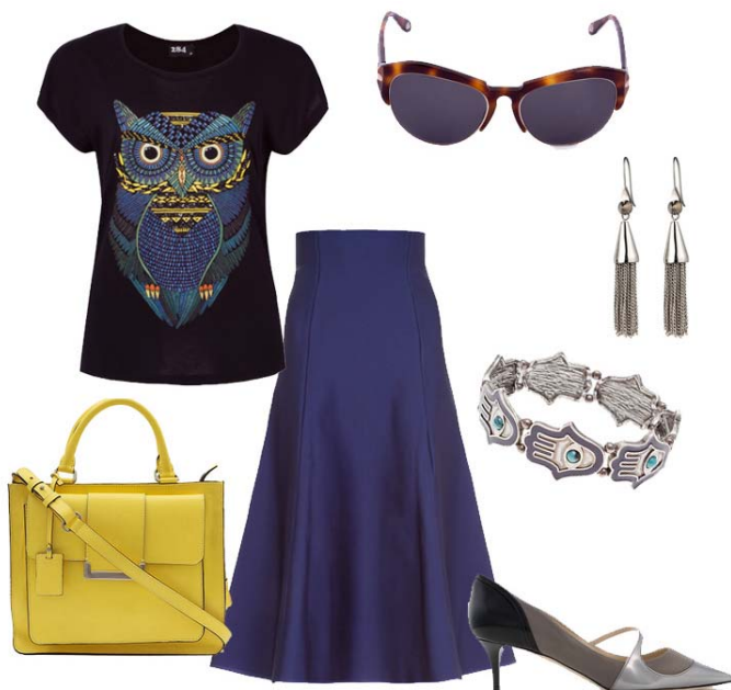
T-Shirt 284, Saia Lolitta, Scarpin Jimmy Choo, Bolsa Cori, Óculos Givenchy, Brincos Eddie Borgo, Pulseira Gio Bernardes