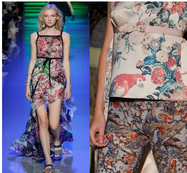
Elie Saab e Giles Spring Summer 2016

Um lado é traiçoeiro. É aquele em que faz você tomar decisões movidas pelo impulso da “grande” oportunidade de comprar por um valor reduzido. E é aí que está o risco de encher o closet com peças descoordenadas, que não fazem seu estilo, que não possuem qualidade e que acabam não sendo usadas. É o barato que sai caro.