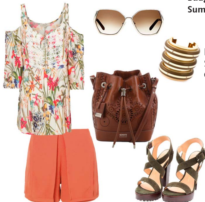
Blusa Fillity, Short Lila Deux, Bolsa Schutz, Sandália Luiza Barcelos, Óculos Chloé, Bracelete DSquared2

Nas passarelas do Spring Summer 2016, foram apresentadas estampa lindíssimas, mas, em se tratando de primavera/verão, sabemos que os florais têm reservado seu lugar vip.