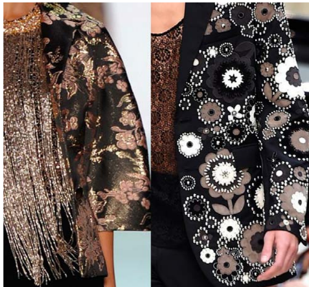
Badgley Mischka e Burberry London Spring Summer 2016