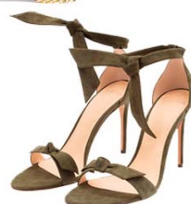
Vestido Sacada, Sandália Alexandre Birman, Bolsa Jimmy Choo, Brincos Tory Burch