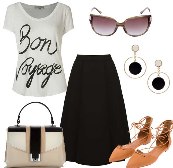
T-shirt Fillity, Saia Versace, Sapatilha Schutz, Bolsa Aquatalia, Óculos Escada, Brincos Bitri